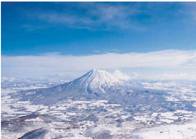
蝦夷富士・羊蹄山